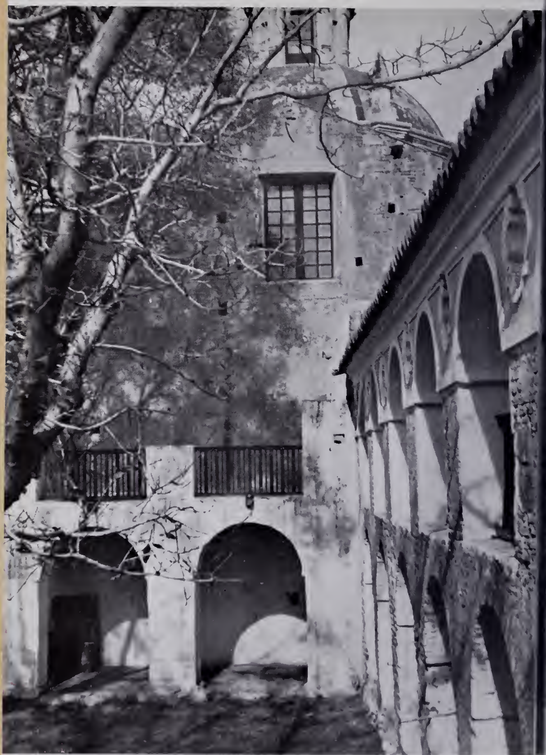
Jesús María. Interior del "patio de los naranjos". Lado S. O.